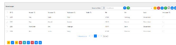
Abb. Maske Bewerbungen