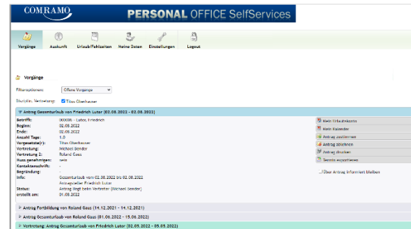
Personal Office - Self Service - Anträge

COMRAMO AG Bischofsholer Damm 89 30173 Hannover