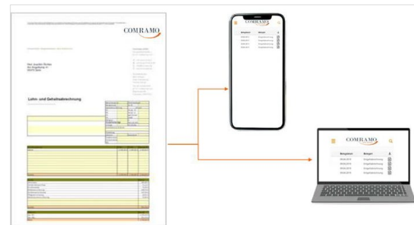
Aus Papier wird Digital

COM.hr management digitale entgeltabrechnung